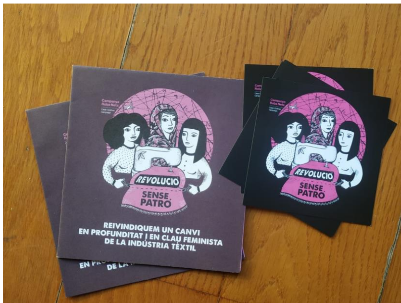
Díptics de la campanya "Revolució sense patró", última campanya que es va impulsar a Catalunya dins del marc de la Roba Neta.