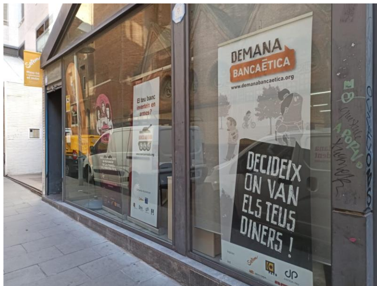
Cartel (roll up) de la campanya Roba Neta (sostinguda a partir del programa Drets Descosits), a la seu de l'entitat, entre la porta principal i els cartells de la campanya sobre la banca, no deixa dubtes de l'aposta de l'entitat per la rellevància i implicació amb aquest projecte, i una forta línia d'acció.

correspon totalment amb els seus principis i trajectòria. D'alguna manera, es podria concloure a partir de les entrevistes realitzades que el projecte Drets Humans Descosits, per la seva temàtica i per la seva contribució a la campanya Roba Neta, és uns del projectes més forts i que a més dona identitat i investidura a l'entitat executora. Setem Catalunya va dissenyar i impulsar el projecte Drets Humans Descosits, però el projecte també va impulsar l'entitat, especialment quan aquesta va passar per un greu conflicte intern. I la força del projecte, sense dubte està en la convicció per la rellevància de la problemàtica. En paraules d'una persona entrevistada: "Setem ha impulsat i ha donat forma a aquest projecte, i ara [es refereix al conflicte intern] aquest projecte ha donat força i impuls a l'entitat".